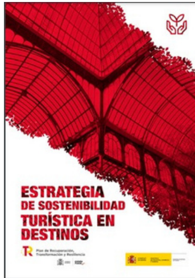
Imagen 1: Estrategia de sostenibilidad turística en Destino

En resumen, el turismo ha evolucionado desde ser una actividad exclusiva para unos pocos privilegiados hasta convertirse en una industria globalizada y accesible para la mayoría de las personas. Por esto, la necesidad de promover un turismo responsable y sostenible se ha vuelto esencial para garantizar la preservación de los destinos turísticos y el bienestar de las comunidades locales.