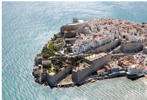
Imagen 2: Vista aérea Castillo de Peñíscola

● Conservación del patrimonio cultural y natural: El turismo puede ser una fuente o motivo de financiación para la conservación y preservación del patrimonio cultural y natural de un destino. Los ingresos generados pueden destinarse a la restauración de sitios históricos, la protección de áreas naturales y la promoción de la cultura local.