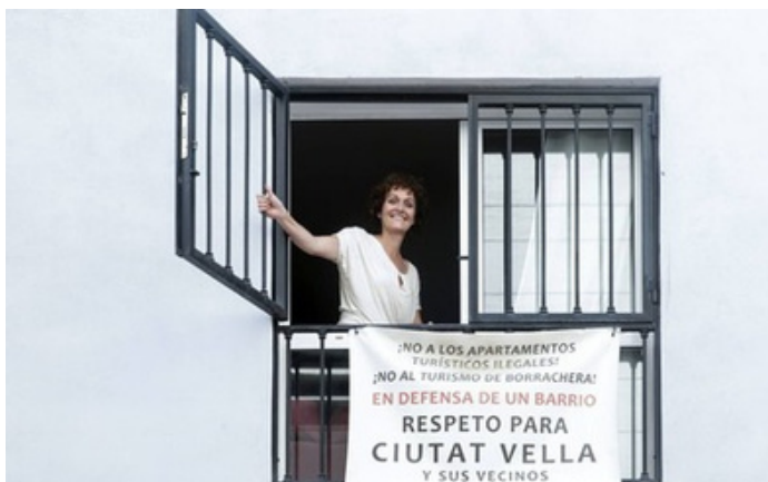
Imagen 3: Una vecina, con un cartel contra los apartamentos turísticos ilegales IRENE MARSILLA Fuente: https://www.lasprovincias.es/